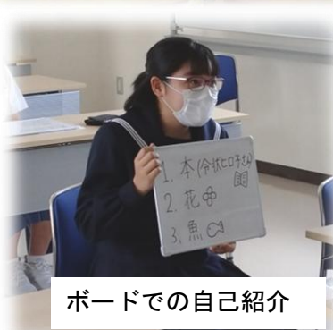
ボードでの自己紹介