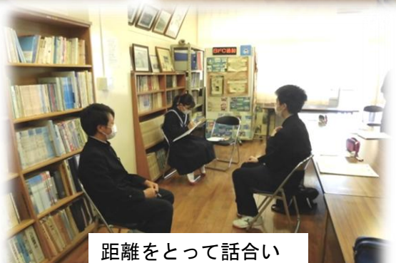
距離をとって話し合い