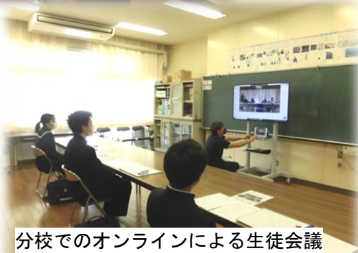
分校でのオンラインによる生徒会議