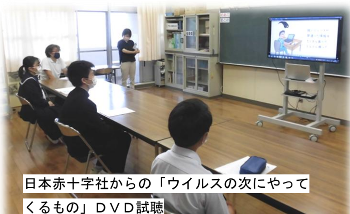
日本赤十字社からの「ウィルスの次にやってくるもの」DVD視聴