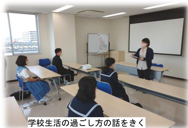
学校生活の過ごし方の話をきく