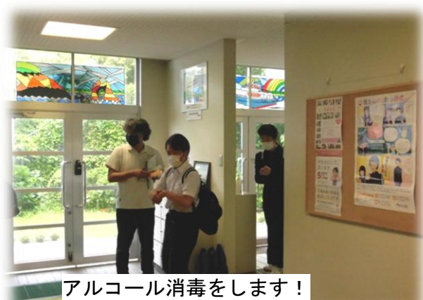
アルコール消毒をします！