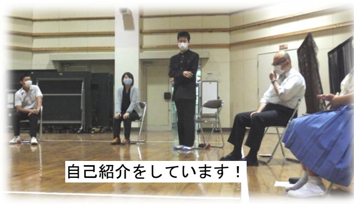
自己紹介をしています！