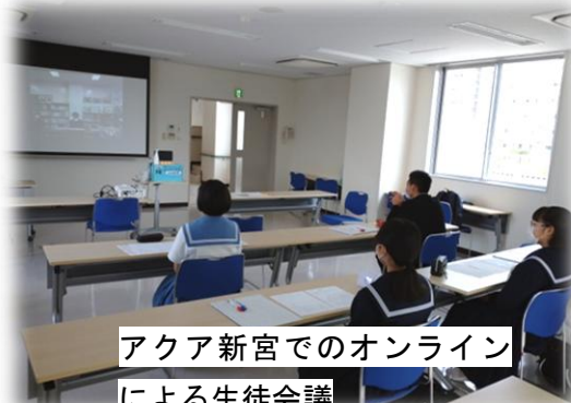
アクア新宮でのオンラインによる生徒会議

オンラインで自分の好きなものを取り入れた自己紹介、対面式でのレクレーションの内容について話し合いを行い、お互い意見を出し合いました。お互いの表情や声が聞けて心がつながっていることを感じることができました。これからもできることを探りながらつながっていけるといいですね。