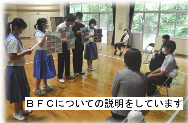
BFCについての説明をしています