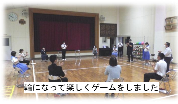
輪になって楽しくゲームをしました

5月25日(月)、初めて分校生徒7名と職員9名がようやく全員そろい、全校集会を行いました。全校集会では、1年生2人の新入生誓いの言葉、生徒会長の新入生歓迎の言葉、そして2、3年生代表による新年度への抱負が述べられました。落ち着いた堂々とした態度とこれからの向けての決意が感じられる立派な発表でした。また、26日には2、3年生が中心となって対面式を行い、3密を避ける工夫をしながらみんなで楽しい時間を過ごしました。