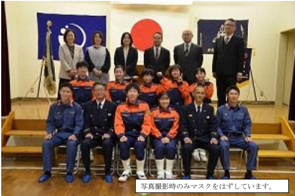
写真撮影時のみマスクをはずしています。