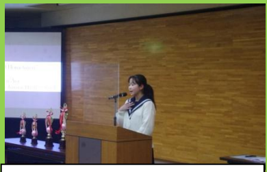
英語スピーチコンテスト