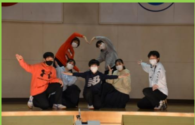
スポコン広場の応募に向けて