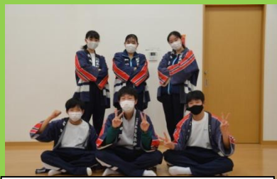
夜回り（昼回り）を終えて