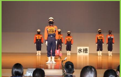
中文連でのポンプ操法