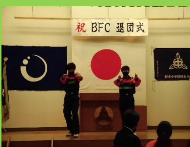
学びの成果を披露