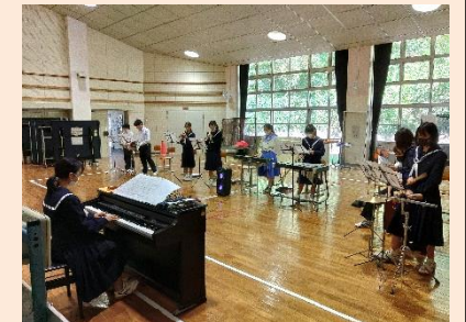
合奏練習 アンダー・ザ・シー

○11月から来年2月末まで，新宮渡船が冬便(相島発17時の便が最終便)になります。漁村留学生はこの17時便で下校しますので，帰宅時間が30分程度早まります。日没時間も早くなるので，帰宅時の安全確認もよろしくお願ひします。