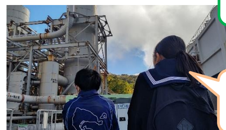
自然の力を利用 八丁発電所