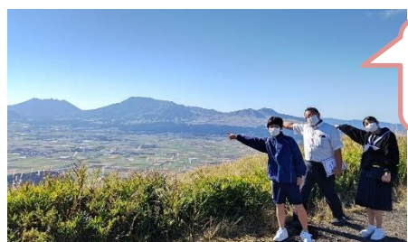
南北25Kmのカルデラ 大観峰