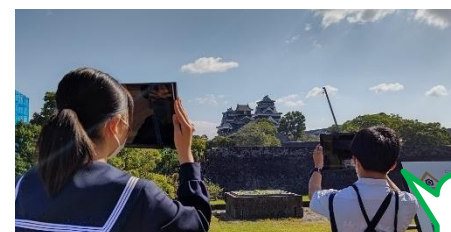
2037年復旧予定の熊本城

2年生は、10月18日(火)から2泊3日の修学旅行がありました。熊本地震災害からの復興が見られる地域や阿蘇山等の火山と共存する地域、阿蘇山大噴火による地形を産業に生かす地域などで研修を行い、その中でしなやかに生活するための工夫や知恵に関する体験や体感的な活動をしてきました。スローガンは「熱い志と冷静な判断」。これには次のような思いがあるそうです。「私たちは、修学旅行に向けて、熱い思いをもって準備をしてきました。そして、3日間の修学旅行でもさらに熱い思いをもって学習してきます。その際、落ち着いて判断・選択をすることを心掛けたいと思います。私たちは、災害からの復興と地域の活性化にける人々の熱い思いを体感していきたいです。その際、人々がどのような判断・選択をしたのかを見聞し、これから最上級生となるための学びにしたいです。」。自然現象や災害の中で生きる人たちの「熱い志と冷静な判断」を学ぶ修学旅行です。バスの中では、研修前に学習ポイントを説明し合い、研修後にはそれぞれ感想を発表しました。「復旧途中の熊本城を見て復興の大変さを感じた。」「原尻の滝、鍋ヶ滝、阿蘇火山博物館、数鹿流之碑では、火山や地震の影響のすごさを実際に見ることで感じる事ができた。」「自然の美しさを感じる事ができた。」「副校長先生やガイドさんの説明がわかりやすく、来年の島ガイドに生かしていきたい。」と目標やスローガンを意識した修学旅行であったことがわかります。1つ1つの感想に達成感や充実感が感じられました。これから2年生は、相島分校のリーダーになります。この修学旅行で学んだことを相島分校のために発揮してくれるものと期待しています。