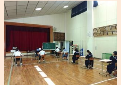
中間考査がんばりました！