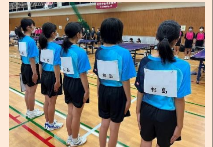
糟屋区中学校新人卓球大会