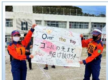
スローガンは「Over the top」！

数人の生徒に聞いたところ、1番楽しみなのは「負けませんバイ！」。水上分団・若潮チームと教職員チームには負けないとのことでした。分校の職員も小学校の先生方と力を合わせて、まだまだ中学生には負けないと意気込んでいます。負けませんバイ！