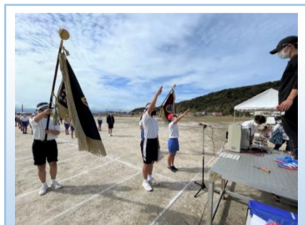
開閉会式の練習もしました