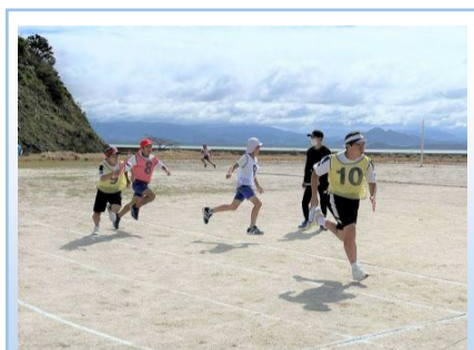
小学生と力をあわせてリレー