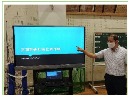
定期考査計画立案作戦

分校では、教科書、ノート、学習プリント、黒板での学習と、Chromebook や電子黒板を使った学習をミックスして授業を行っています。生徒たちもICT を上手に活用して学習を進めている様子が伺えます。特に、先日の理科の自由研究の発表は見事でした。Google ドキュメントなどを使って身の回りの疑問などの観察や実験をまとめ、Google スライドを使って相手に伝える活動をしました。また、その他の授業でもタブレットドリルを使ってそれぞれの習熟度にあった課題に取り組んだり、Chromebook や電子黒板を使って考えを共有したりしてそれぞれが成長するための学習活動をしています。今回の中間考査に向けての家庭学習でも上手にChromebook を活用してほしいと思います。