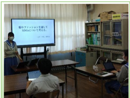
全校生徒で理科自由研究発表会