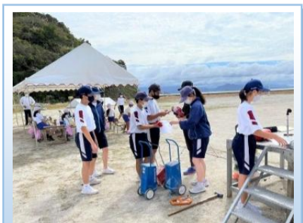
係の仕事ががんばっています

明後日10月2日（日）の相島区秋季大運動会に向けて、9月28日（水）にリハーサルを行いました。出場する種目での動きの確認や、それぞれの係の仕事の流れを確認しました。どの場面でも、中学生が小学生に優しく声をかけ、主体的に動いている様子が印象的でした。また、BFC ポンプ操法の後には小学生から「かっよかった」と声をかけられていました。リハーサルの後には、うまくいったところやうまくいかなかったところをそれぞれ出し合い、改善策を考えました。これまでの行事や取組を通して、自分の役割を意識して動くことができるようになった姿に分校生徒の成長を感じます。本番では、保護者の皆さんや島の皆さんにも分校生徒の成長を見てもらえることが楽しみです。