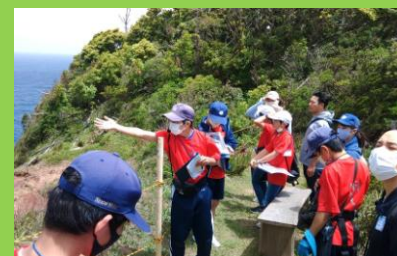
【保護者に島ガイド】