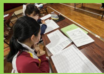
【I-study1 2 Pro の活用】