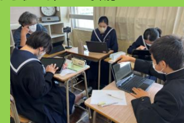
【分散登校：学びの継続】