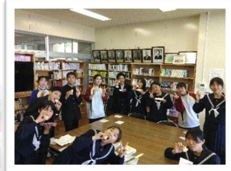
〈島ガイドのお礼の品をみんなで!〉