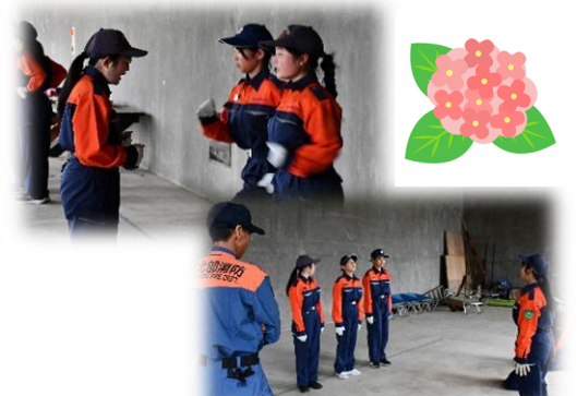
〈BFC 規律訓練 1年生も頑張っています〉