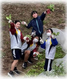
〈技術の時間でラディッシュの収穫!!〉