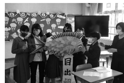
【17日 第145回 卒業証書授与式】

また、本日は、今日で漁村留学を修了する皆さんともお別れをしました。活躍を応援しています。