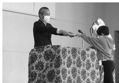
修了証をもらう2年生

1年間ありがとうございました。今後も学校への変わらぬご支援ご協力をよろしくお願いいたします。