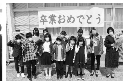
【24日 留学修了の4名の皆さん】