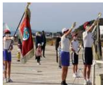
運動会開会式の選手宣誓

10月30日（土）に待ちに待った「相島区秋季大運動会」を行いました。2年ぶりの開催に子どもも大人も笑顔がはじける一日となりました。開催に向けて、3回の運動会代表者会を行い、感染症対策を徹底して開催となりましたが、青空のもと思いっきり体を動かした子どもたちの笑顔は最高でした。どの子も練習の成果をしっかりと発揮し、達成感いっぱいでした。相島区の皆さんとともに開催できたことで、地域の皆さんの温かな優しさに触れ、中学生との合同練習で学びのよい手本に出会い、最後まで全力で取り組むことの大切さを学んだ最高の教育活動となりました。