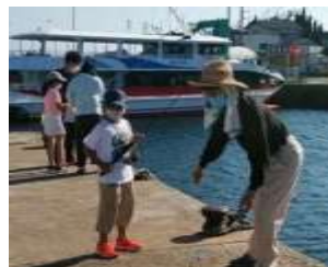
全学年 釣りクラブ