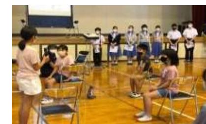
分校発信「いじめゼロ集会」10月12日