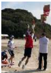
15名の心一つに「This is Aisyo!」

今後もコロナ禍であっても、地域と家庭と中学生とつながり、子どもたちの力を伸ばしていきたいと考えています。運動会を支えてくださった相島区の皆様、PTAの役員の皆様、本当にありがとうございました。今後も本校教育活動に対するご理解とご協力をお願いいたします。