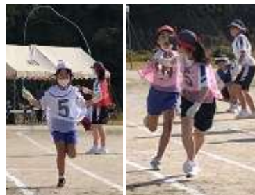
中学生と一緒にいろんな種目にチャレンジ