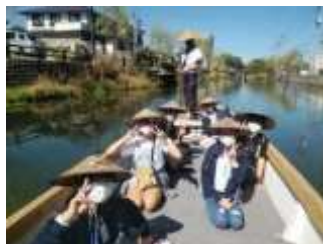
6年 修学旅行（柳川 川下り）

10月1日（金）に緊急事態宣言が解除されて1か月、感染症対策を徹底しながら、新しいスタイルで教育活動を進めています。10月14日・15日には、6年生が修学旅行に、14日は、5年生が自然体験教室として立花山・新宮オルレコースにチャレンジしました。また、3・4年生は、社会科見学や魚捌き体験、5年生は、オンラインで社会科見学、全学年のクラブ活動では、釣りを行いました。コロナ禍前の体験活動のよさを、工夫しながら新しいスタイルで行い、学びを深めています。保護者、地域の皆様には、いろんな面で支えていただきありがとうございます。