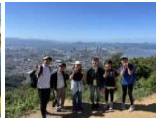
5年 自然体験教室（立花山）