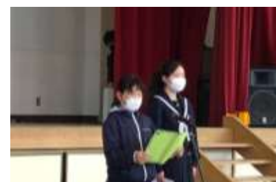
【令和3年度 漁村留学閉講式】