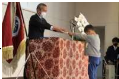
【修了証をもらう1年生】

来年度は、小学生留学生18名、中学生6名の計24名がお世話になります。また、1名の新入生を迎えて、全学年がそろった、にぎやかなスタートになりそうです。来年度も『相島の学校・家庭・地域』と『留学の子ども・家庭』が、共に元気になるコミュニティスクール相島小学校を創ってきます。1年間ありがとうございました。今後も学校への変わらぬご支援ご協力をよろしくお願いいたします。