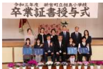
【令和3年度 卒業証書授与式】

また、本日は、今日で漁村留学を終了する4年生ともお別れをしました。新宮北小学校での活躍を応援しています。