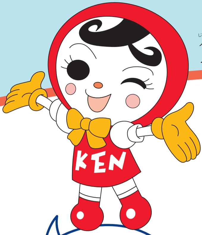
じんけん 人権イメージキャラクター じん 人KENあゆみちゃん