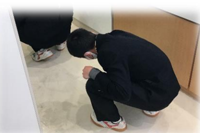
主体的に清掃活動する様子