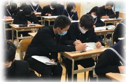
後輩への学習支援の様子

2月は、多くの3年生が仲間や後輩のために主体的に行動してくれました。1日(月)～3日(水)には、「がんばれ3年生!!学習徹底ウィーク」の取組として、12名の3年生が2・1年生の教室で後輩に学習支援を行ってくれました。8日(月)～10日(水)には、3学年の皆さんがそれぞれの目標に向けて、一日の気持ちのよいスタートを切れるようにと、18名の3年生が朝の登校時間に挨拶や遅刻をなくす呼びかけを行ってくれました。17日(水)には、23名の3年生が卒業式実行委員に立候補してくれました。仲間や後輩、学校のために素直な心で主体的に行動できることは素晴らしいです。全員で一体感をもって何事にも取り組んでいきましょう。