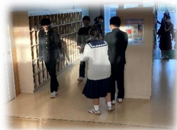
朝の挨拶運動の様子