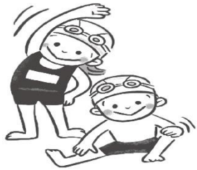
しっかり準備運動

プール学習を楽しみにしている人も多いと思います。ルールを守って事故やケガのないようにしましょう。