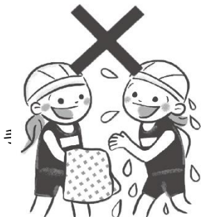
タオルの貸し借りをしない