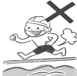
プールサイドを走らない