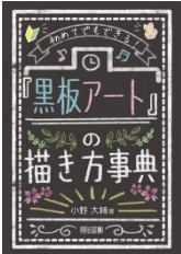
『黒板アートの描き方事典』 小野大輔/著 明治書院 725オ