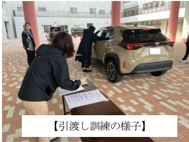
【引渡し訓練の様子】

そんな中、11月11日(土)(新宮町教育の日)に、今年度も引渡し訓練を実施しました。今回は、ドライブスルー方式の対象地区を夜白2,3,4区とし、通常の引渡しと並行して行いました。渋滞を予想し、迎えの時間を制限したり、迎えに来る車の通行ルートを一方向通行にしたりするなど昨年度以上に工夫をしましたが、次の感想にあるように、北駐車場と学校前の交差点が、かなり混雑してしまう時間帯ができてしまいました。