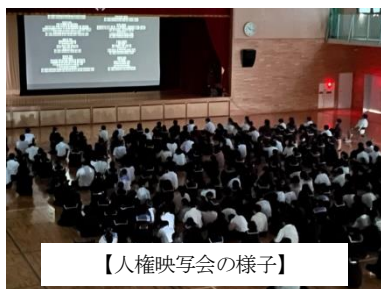
【人権映画会の様子】

11日(土)(新宮町教育の日)には、2年生が、保護者にも参観いただきながら、人権平和映画会を行いました。今年度は、「性の多様性」をテーマにした「リトルガール」を観賞しました。