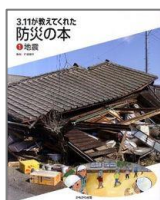
『3・11が教えてくれた防災の本①地震』 片田敬孝/監修 369 ㉔ かもがわ出版

報道されなくなったからといって、復興されたわけではない。復興されたからといって忘れてよいわけではない。私たちができることは、何でしょうか？ この本や新聞などから、東中で学んでいることを振り返ってみましょう。