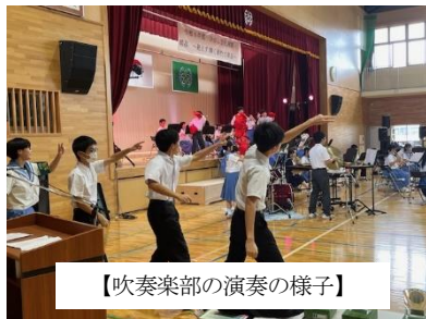
【吹奏楽部の演奏の様子】

吹奏楽部の演奏では、会場のみみんなで一緒に楽しめる演奏と演出を披露し、全校生徒で楽しく踊りました。