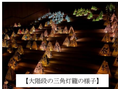
【大階段の三角灯籠の様子】

生徒たちの姿から、改めて、文化芸術というものが、人の心を豊かにしてくれる大切なものであることを再認識しました。これからも、あたたかい温もりのある東中でありたいと思います。ご支援よろしくお願ひします。