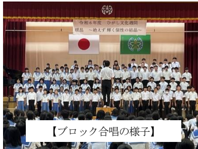
【ブロック合唱の様子】

今年度の合唱は、ブロックで1つの合唱を創り上げるブロック合唱を行いました。どのブロックも、素敵な歌声を響かせてくれました。