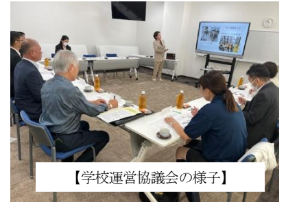
【学校運営協議会の様子】

10月28日(月)、第2回学校運営協議会を実施しました。今回は、評議員の方に授業を参観いただいた後、学校から、学校運営に関する3つの重点についての中間報告を行いました。