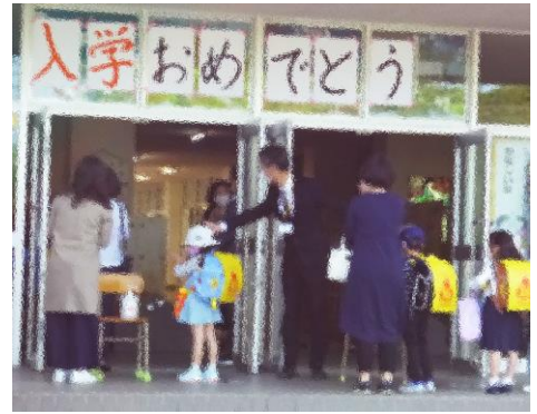
【1年生の登校初日の様子】

さて、5月19日(火)は、1年生の分散登校の日でした。入学式が中止になり、入学手続きには保護者のみの参加でしたので、1年生の登校はこの日が初めてでした。新しいランドセルを背に保護者と一緒に登校してきた子供たちの笑顔がとても眩しかったです。