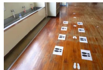
【ソーシャルディスタンスを 確認させるための印】