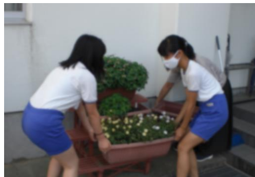
【進んで行動する6年生の姿】

さて、本校の本年度の重点目標は『学校・家庭・地域が連携・協働し、進んで行動するたくましい子を育てる』です。この目標としている姿が、6年生の日々の行動に表れています。台風10号接近に伴い、臨時休校前に子供たちの一人一鉢の植木鉢やプランターを棚から下ろし、棚も安全なところに移動させる作業を職員で行っていました。休校明け、棚や植木鉢、プランターを元に