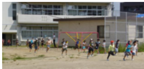
【静かに安全に避難することができました】

9月8日（火）に、火災を想定した避難訓練を行いました。今回の避難訓練は、感染症防止対策として、1校時に1・6年、2校時に2・5年、3校時に3・4年と3回に分けて行いました。子供たちは、各学級で避難するときの心得（「お・は・し・も」及び避難訓練の必要性）、避難経路、避難場所について確認しました。子供たちは、おしゃべりすることなく、上手に避難することができていました。