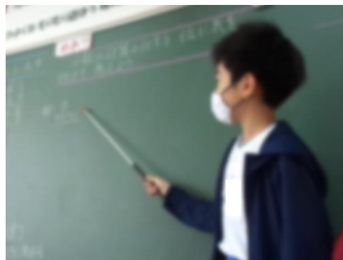
【算数の学習で説明する子供の姿】

保護者の皆様には、引き続き子供たちへの励ましや子供たちの体調管理をお願いいたします。厳しい暑さを共に乗り切りましょう。