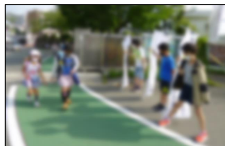
【運営委員会による挨拶運動】

本年度、子どもたちに特に頑張してほしいことの一つに『つながる「挨拶」』があります。5月12日からの1週間、運営委員会の子供たちによる朝の挨拶運動の取組が行われました。運営委員会の子供たちは、事前に「あいさつカード」を作成して全校の子供たちに配付し、自分たちも進んで朝の挨拶を行っていました。この「あいさつカード」には、気持ちのよい挨拶をするためのポイント（「聞こえる声で」「にっこり笑顔で」「立ち止まって」「相手の目を見て」など）が示してあります。そのポイントを意識しながら、子供たちの挨拶がとても上手になってきました。人と人とのコミュニケーションにとって、気持ちのよい挨拶は大事なものです。このようなポイントを意識した挨拶を、地域や家庭でも広げていきましょう。