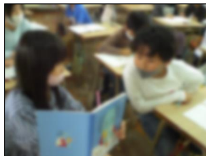
【算数科の学習における交流】