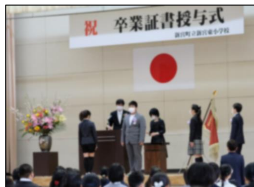
【第33回 卒業証書授与式】

卒業生は中学校へ、在校生は一つ上の学年へ、それぞれ新たなステージへ進みます。保護者の皆様には、お子様の成長と頑張りを認め、励ましていただき、進級への希望と目標をもたせていただきたいと思います。そして、4月6日（水）の令和4年度の始業式では、希望に満ちたキラキラ輝く子どもたちの笑顔に再会できることを楽しみにしています。