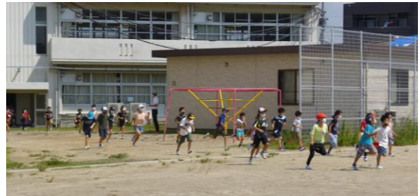
【静かに安全に避難することができました】

ご家庭では、出火しないように気を付けること、また火災発生時にはどのような対応を行うべきなのかということを一度確認してみてください。