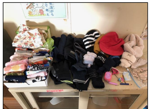
裏面もご覧ください

2月16日(木)の学習参観時、昇降口付近に落とし物を並べておきます。お子さまのものがいないか、一度ご確認ください。