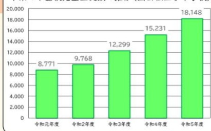
本県の不登校児童生徒数の推移（国公立小中学校）

◆さらに、欠席が続くようであれば、学校に加えて、お住まいの市町村の教育支援センターや、市町村や県が設置している相談窓口等に相談することもできます。