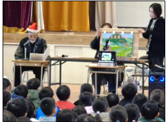
【「人丸姫」読み聞かせの様子】

さて、本日、子どもたちに「あゆみ」を配付しています。全体的にご覧いただき、まずはお子さんの頑張りや成長を認め、たくさん褒めてあげてください。保護者の方の称賛や励ましが、お子さんの自信とやる気につながります。その後、今後の課題について話し合っていたきたいと思います。年末の慌ただしい時期になりますが、体調には十分お気を付けいただき、よい年をお迎えください。