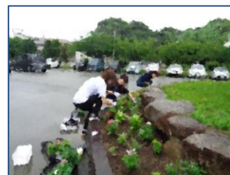
【雨の中、行ってくださった花壇整備】

11月の「東っ子フェスタ」をはじめ、花壇の花の植え替えやトイレ清掃、新家庭教育宣言の取組、地域の危険箇所確認など、様々な場面で子どもたちのためにご尽力いただきました。待てっ隊の皆様には、暑い日も寒い日も、毎日登下校の様子を見守っていただき、子ども達は安全に通学することができました。PTCAの皆様、地域の皆様のおかげで、子ども達にとって大変充実した1年になりました。本当にありがとうございました。