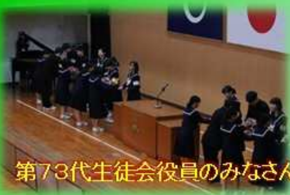
第73代生徒会役員のみなさん、1年間ありがとうございました