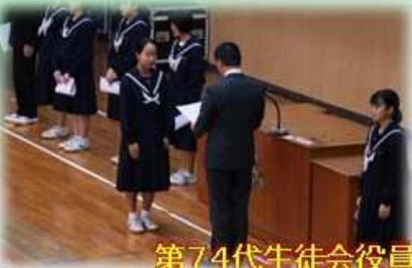
第74代生徒会役員の認証式と所信表明

この礎に、これから新生徒会のメンバーが新しい伝統を築いてくれることを大いに期待します。