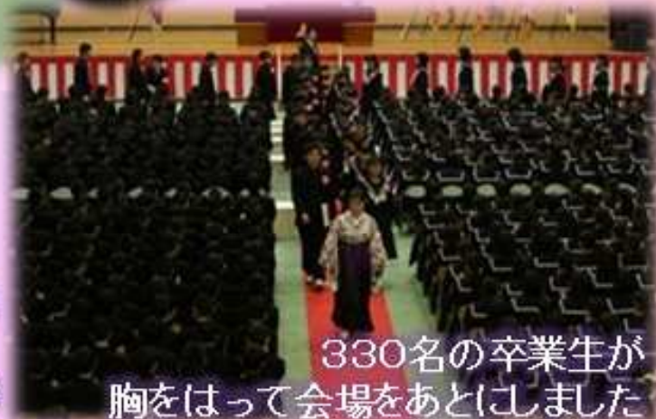
330名の卒業生が 胸をはって会場をあとにしました