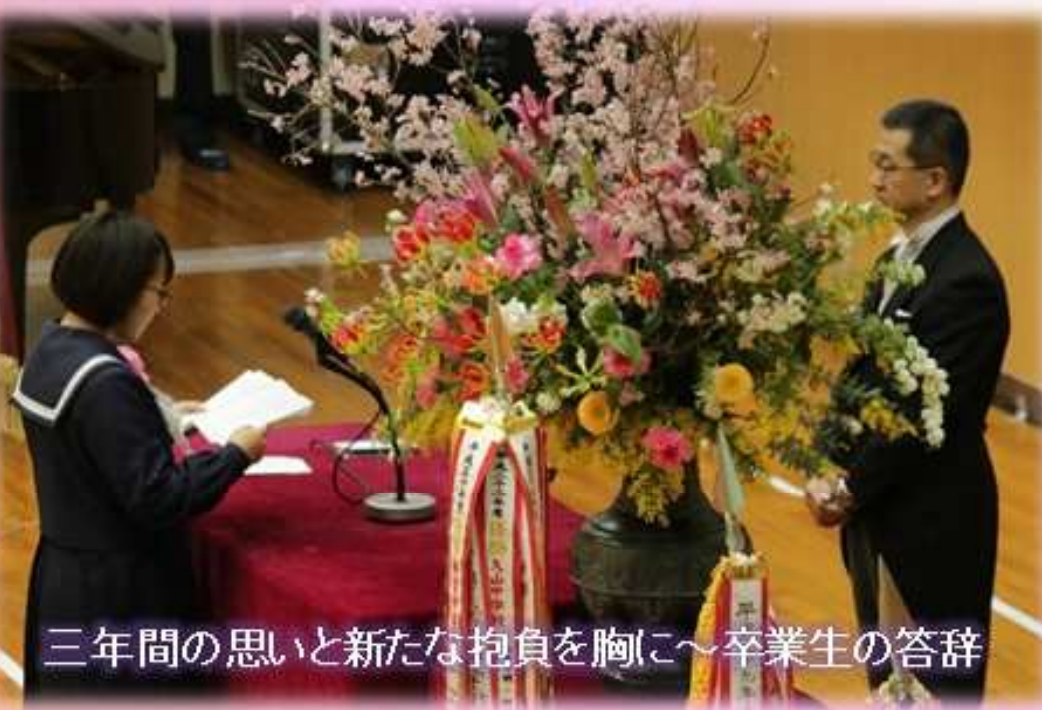
三年間の思いと新たな抱負を胸に～卒業生の答辞