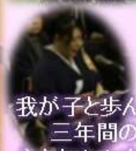
我が子と歩んだ 三年間の思いに 心を打たれました ～保護者代表挨拶