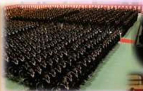
中学校生活最後となる 校歌斉唱