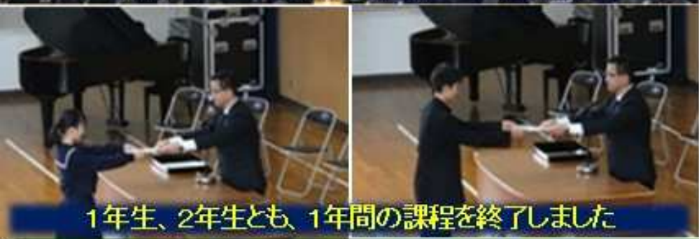
1年生、2年生とも、1年間の課程を終了しました