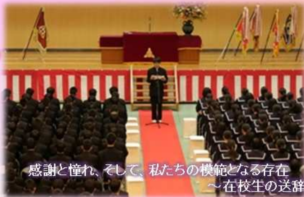
感謝と憧れ、そして、私たちの模範となる存在 ～在校生の送辞