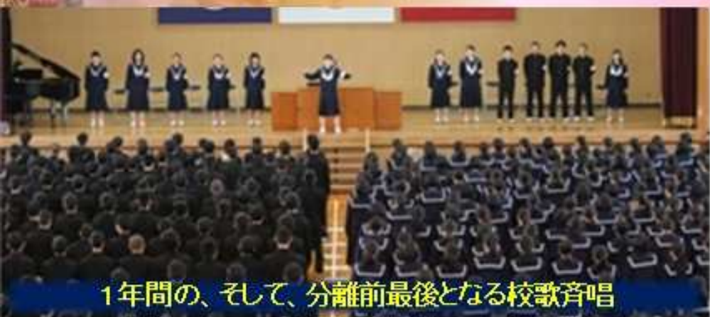
1年間の、そして、分離前最後となる校歌斉唱