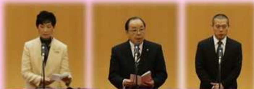
ご来賓の皆様より心温まるお祝いのお言葉をたくさんいただきました