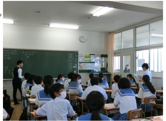
1年2組 道徳の授業風景