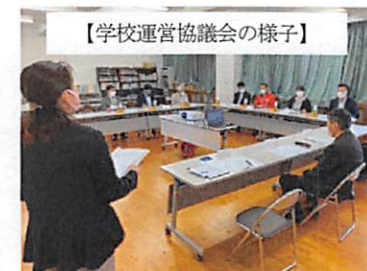
【学校運営協議会の様子】