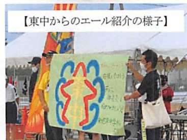
【東中からのエール紹介の様子】