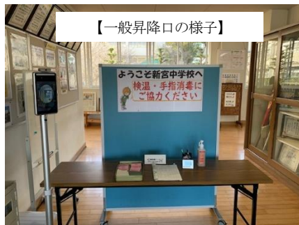
【一般昇降口の様子】

右の写真は、昇降口の様子です。生徒昇降口だけでなく、外部から校内に入ってくる方にも注意喚起を促し、リスクの軽減に向け協力をお願いしています。