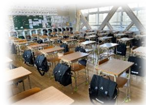
取組期間中の教室の様子 (靴や棚がキレイに整えられています。)

体育会で学んだことをこれらの生活に生かし、今年度を終えた時に、学校、学年、学級、みなさん一人ひとりが どれだけ成長できたかが、「伝統」が「伝説」になるときだ と思います。全校生徒皆さんのさらなる活躍を期待します。