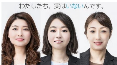
わたしたち、実はいないんです。

文部科学省は7月4日、対話型AI「チャットGPT」をはじめとした生成AIの利用に関する小中高校向