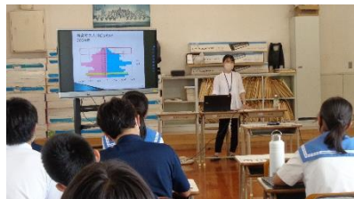
【1年生：役場の方の講話を聞く様子】

皆さんが2学期に楽しみにしている取組のひとつに、総合 Days があるのではないのでしょうか。各学年の