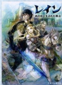
『レイン 雨の日に生まれた戦士』 吉野匠／著 (アルファポリス) 請求記号 913ヨ

2005年に書籍化された大人気WEB小説。最強の戦士・レインが活躍する剣と魔法の異世界ファンタジー。