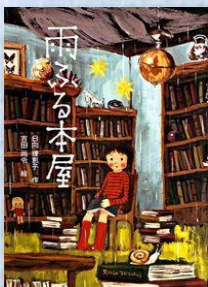
『雨ふる本屋』 日向理恵子／著 吉田尚令／イラスト (童心社) 請求記号 913ヒ

私は「哲学・宗教」です。古今東西の哲学、仏教やキリスト教に関する本がそろっています。また、心理学や道徳なども含みます。人生に悩んだ時、じっくり考えたい時は、私の書棚を訪れてみてはいかがでしょうか。そうそう、占いの本もここにありますよ。