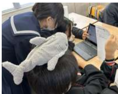
クロムブックを使って 作成中

12月23日(火)に、「学級レクリエーション」が行われました。この活動は、実行委員を募集し、生徒たちが中心となって、「2学期を頑張った自分やなかまを認め、達成感を味わう」「なかま意識を高め、3学期も前向きに頑張ろうとする意欲を高める」ことを目的に取り組みしました。内容は、グループに分かれて、みんなが楽しめるゲームを考え、学級で実際に行うというものです。グループ名を自分たちで考え、ユーモアあふれるネーミングでみんなを楽しませてくれました。当日は、クロムブックを使ってクイズ大会やイントロ当てクイズなどを企画し、大いに盛り上がりました。