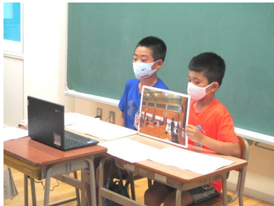
オンラインによる発表の様子

新宮中学校区の合言葉「ささえ愛・みとめ愛・はげまし愛 ～やさしさの心を結び、なかよしの花を咲かせよう～」をもとに、いじめゼロを目指して取り組んでいきます。