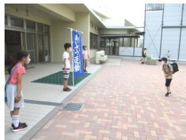
あいさつ運動の様子

7月20日（火）の1学期終業式を控え、学校では、新しい生活様式を踏まえながら、学習や生活の充実を図り、学習内容のまとめに取り組んでいます。ご家庭でも、この時期を有意義に過ごすことができるように、見守りをお願いします。