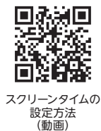
スクリーンタイムの設定方法(動画)