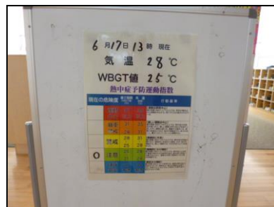
【熱中症予防の呼びかけ】

さて，気温が高い日が増えてくるこの時期に心配なのが，熱中症です。新型コロナウイルス感染防止のため，日常的にマスクを着用して生活している現状では，その危険性も高まります。そこで，学校では，こまめな水分補給や帽子の着用，運動の制限などの熱中症予防対策を行いながら取り組んでいます。特に，体育の学習などでは，十分な距離を保ちつつマスクを外すような対応を行っています。また，登下校中につきましては，お互いの距離をとる，会話を控えるなどの感染対策を行った上で，自分の判断でマスクを外せるよう学級で話しておりますので，ご家庭でもご確認をお願いいたします。今後もお子さんの健康状態に留意して，様々な対策を行いながら教育活動を進めていきますので，ご家庭でもご協力をお願いいたします。