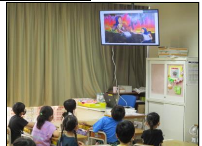
【テレビ放送で学ぶ子どもたち】

6月17日（金）、全校一斉に平和学習を行いました。まず、テレビ放送で今から77年前の「福岡大空襲」について学んだ後、それぞれの学級で絵本「へいわとせんそう」をもとに、命と平和の大切さについて考えました。最近、ニュース番組等で戦争と平和についての報道が多く見られます。「生命」に対する畏敬の念が子どもたちに育つよう、平和であることの大切さや命の尊さについて、お子さんと一緒に考えてみてください。