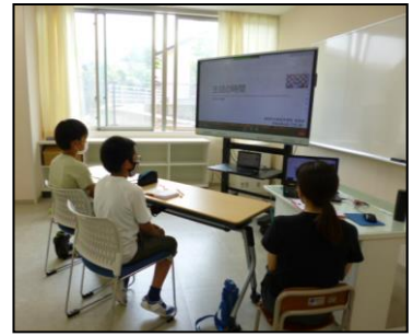
【第1回いじめゼロサミット】

新宮町では「いじめを『しない・させない・みのがさない』子どもたちの育成」を目指し、中学校区ごとに「いじめゼロ宣言」の取組を行っています。その取組の一環として6月17日（金）に「第1回いじめゼロサミット」がオンラインで開催されました。本校からは5・6年生が参加し、本校のスローガンや取組について、運営委員会の委員長・副委員長の二人が児童代表として堂々と発表してくれました。今後は、新宮北小学校における「いじめゼロ」の取組について話し合い、進めていくこととなります。