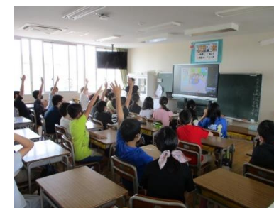
規範意識育成事業の様子 (6年生)