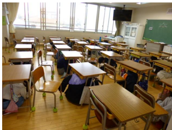
地震を想定し、机の下にかくれている様子

保護者の方に参加していただいている「引き渡し訓練」でお知らせしていますように、新宮北小学校では、新宮町で「震度5弱以上」を記録する地震が起きたときには、児童の「引き渡し」を行うことになっています。その際には、