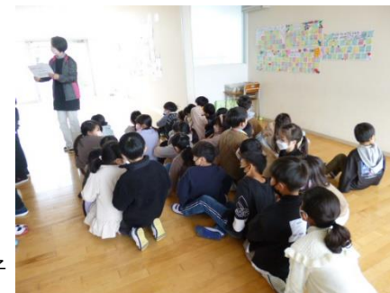
津波を想定し、3階に避難している様子

保護者の皆様に、徒歩で来校し、体育館から校舎に入り、（きょうだいがいる場合は上のお子様から）教室まで迎えに来ていただくこととなります。校舎の状況によっては、運動場で引き渡しを行います。連絡は「安心メール」及び「ホームページ」で行いますが、機器やネットが使えない状況もあり得ますので、「震度5弱以上のときは迎えに行く」ということの確認をお願いいたします。