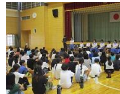
6年生：中学生による「未来へのとびら」講話

また、「そよかぜ」の皆様による朝の活動の時間や昼休みにおける読み聞かせや、「くすの木語りの会」の皆様による読み聞かせの時間は、北っ子たちにとって楽しい時間になっています。これからも地域の「人・もの・こと」を大いに活用して、学びを深めていきたいと思ひます。