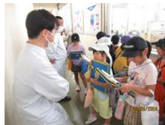
2年生：食品工場見学

2年生は生活科学習で食品工場を見学しました。TVのCMなどでよく見かけるメーカーが、学校のすぐ近くにあることに子どもたちは驚いていました。自分たちがよく口にする食品がつくられていく様子を熱心に見学していました。