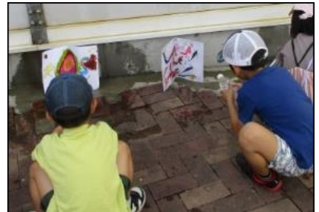
【生活科 水遊びの様子(1年)】

なお、夏休み中、子どもの悩みや変化について気になることがありましたら学校へご相談ください。また、「子どもホットライン24」(裏面)などの相談窓口もございますので、ご活用ください。