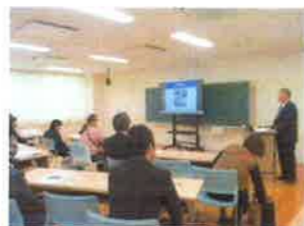
【拡大学校運営協議会】

1校時は拡大学校運営協議会を開催しました。学校運営協議会の委員に加えて、PTAの役員、見守り隊やボランティアの皆様にご集まりいただき、学校運営や子どもたちの状況について説明し、地域での子どもたちの様子や子育てについて意見交換が行われました。