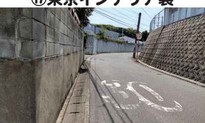
⑭東京インテリア裏

周りに塀があり見通しが悪く、 車がスピードを出してくるため、 注意して通りましょう。