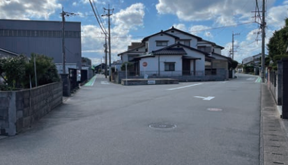
②ニッコー裏の交差点

通り抜けの道で、 車がスピードを出して通ります。 横に広がらず1列で歩きましょう。