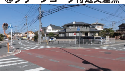
⑱グリーンコープ付近交差点

信号機がない横断歩道です。 車がスピードを出してくるので 注意して渡りましょう。