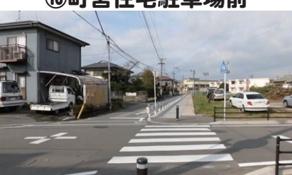
⑬町営住宅駐車場前