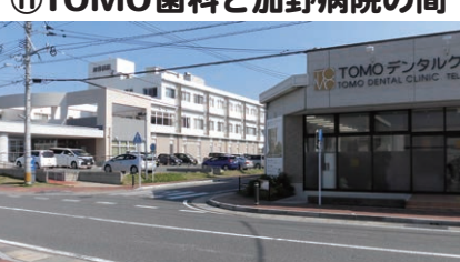
⑱TOMO歯科と加野病院の間