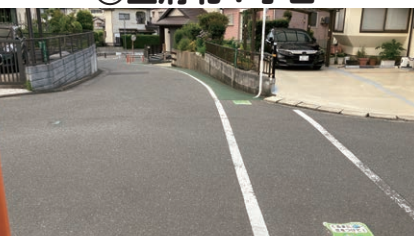
⑰ハローデイ セリア側出入口付近

信号機がない横断歩道です。 トラックがたくさん通るので、 注意して渡りましょう。