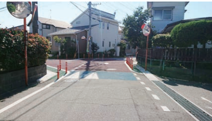
①バンプ・ポールのある交差点

信号機も横断歩道もありません。 いろいろな方向から車が来るので、 注意しましょう。