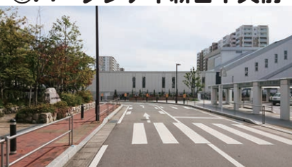
⑦パークシティ新宮中央前

マンションの陰で急カーブに なっており、 路上駐車も多い道です。 注意して渡りましょう。