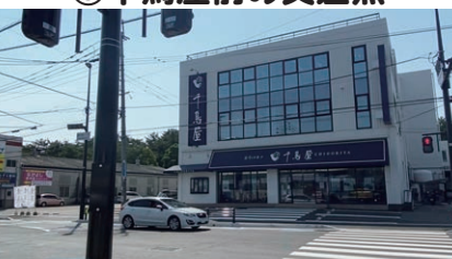
⑤千鳥屋前の交差点