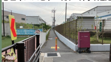
⑥日本ハムとトーカンの間の通路

通学路ではありませんが、 水路の横で街灯も暗い道です。 スピードを出す自転車も多いので 注意しましょう。