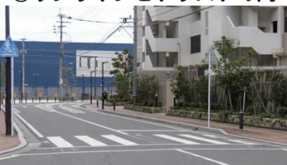
⑧サンリヤンとトラストの間

マンションの陰かつ急カーブで、 見通しが悪い道路です。 注意して、必ず横断歩道を 渡りましょう。