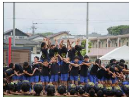
【運動会での6年生の演技風景】

本日、1学期を無事終えることができました。保護者の皆様、地域の皆様、本校の教育活動に対するご理解とご協力をいただき、本当にありがとうございました。さて、1学期の大きな行事であります「運動会」では、今年度の重点目標である「たくましい子」「心豊かな子」をキーワードにしながら取り組んだ姿を保護者の皆様に見ていただきました。2学期以降も、「共に学ぶ子」「心豊かな子」「たくましい子」の北っ子をめざし教育活動を進めて参ります。今後ともご理解とご支援のほどよろしくお願い申し上げます。