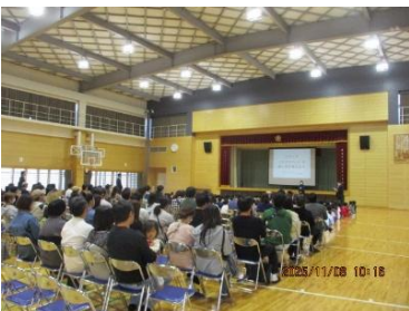
【SNSの取扱いについての学習会】