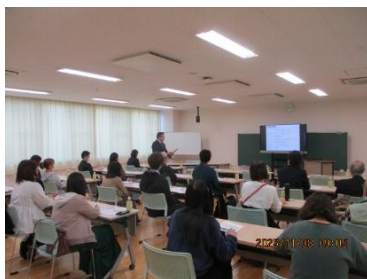
【拡大学校運営協議会】

＊学習参観後に実施した保護者アンケートでは、多くのご意見・ご感想をいただきました。（右グラフ）保護者の皆様から温かい評価をいただくことができました。引き続き本校の教育活動へのご理解とご協力をお願いいたします。