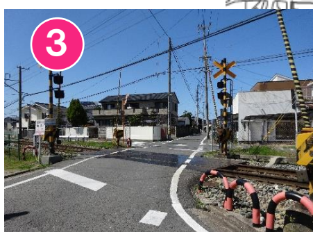
3 ふみきりや道路にとび出してはいけません。