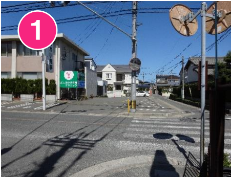
1 交通量が多いので横断歩道をわたりましょう。