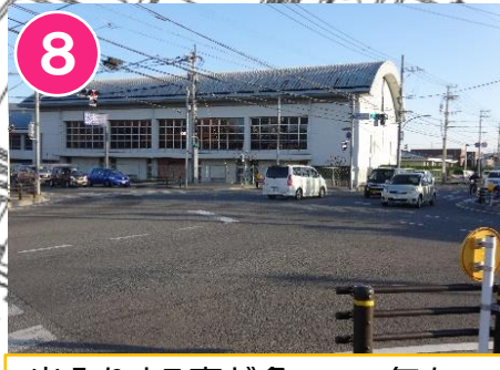
8 出入りする車が多いので気をつけて通りましょう。