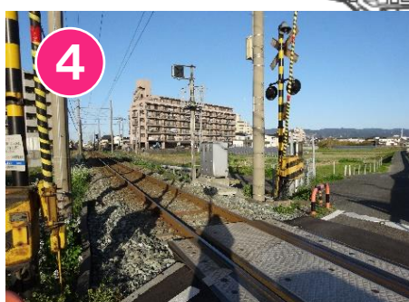
4 線路の中に入はいけません。