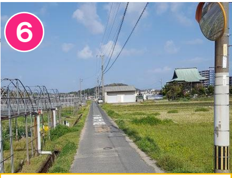
6 道はばがせまいので車がきたらすぐによけましょう。