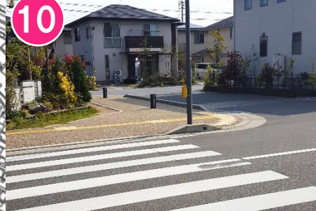
10 横断歩道で止まり左右確認してわたりましょう。