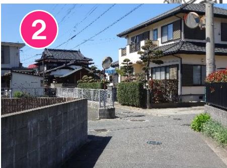
2 車やバイクも通ります。とび出してはいけません。