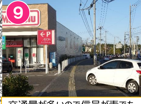
9 交通量が多いので信号が青でも気をつけてわたりましょう。