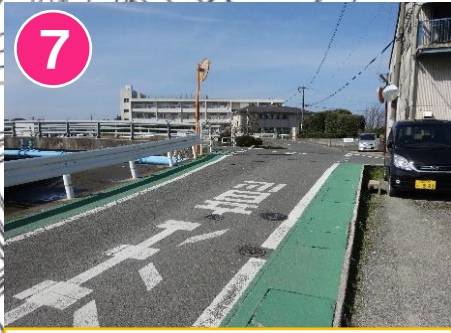
7 道はばがせまく車もよく通ります。緑のゾーンを通りましょう。