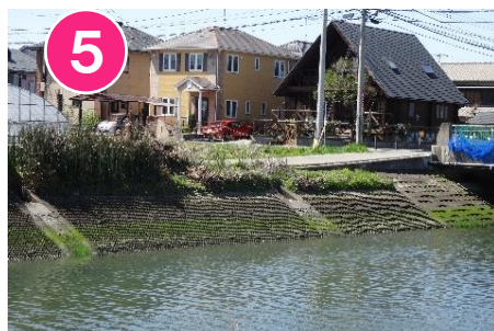
5 川に近づいてはいけません。