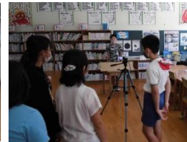
読書リーダーによるパネルシアターと読書クイズの撮影の様子

集会後には、各担任の先生のおすすめの本の紹介など、各クラスで、読書に関する話をする時間を過ごしました。昼休みにはさっそく、多くの子どもたちが、担任の先生のおすすめ本を借りに来ていました。