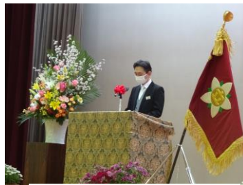
【 学校長式辞 】