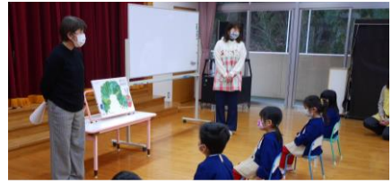
【幼稚園で話をしている養護教諭】

本校は、新宮町立立花幼稚園と隣接しています。この立地条件を生かして、これまで給食や本の貸し出し等、様々な交流を続けてきました。昨年度は、新型コロナウイルス感染防止対策の一環として、立花幼稚園の園児のみなさんと本校の子ども達と一緒に給食を食べることはできませんでしたが、読書リーダーの子ども達が本の読み聞かせに行ったり、教頭や養護教諭が小学校入学に向けての話をしたりして、交流を行ってきました。小学校と幼稚園がそれぞれに行っている教育活動のよさを知ること、子ども達同士や教職員同士が互いにつながりをつくること等が、交流の目的です。本年度も、可能な限り、交流を続けていきたいと思っています。