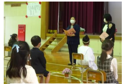
【 担任からの説明 】