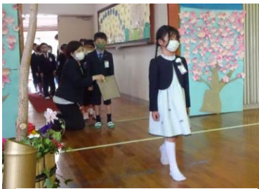
【 入場する新1年生 】

地域の皆様、保護者の皆様、入学した新1年生の子ども達を、みんなで力を合わせて大切に育てていきたいと思えます。温かなご支援をどうぞよろしくお願いいたします。