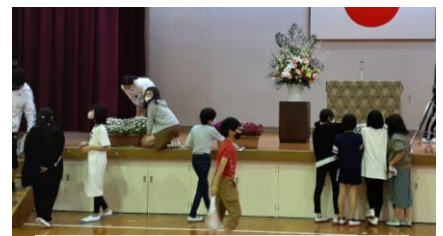
【 入学式準備の様子 】

入学式の前日、6年生は、5年生と一緒に校舎の掃除をしたり、式場の準備をしたりしてくれました。その動きの機敏なこと……。自分から進んで働く姿や、気持ちのよい受け答えにも、頼もしさを感じました。最高学年としての立派な姿を間近で見ていた5年生にとっても、よい刺激になったのではないかと思います。6年生のみなさん、これからも立花小学校の最高学年として、学校をリードしてください。今後の活躍も、期待しています。